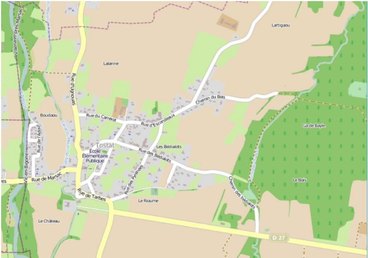
Plan de Tostat 2018